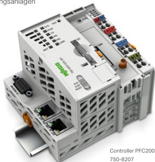
Controller PFC200, 750-8207